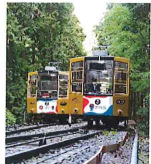
ヘッドマーク掲出イメージ