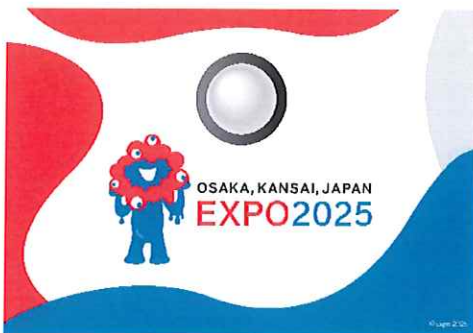
1号車「縁号」掲出のヘッドマーク