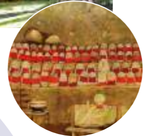
灵窟石佛 (蓬莱丘地藏)