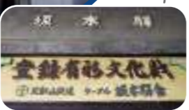
写有旧站名的车站入口