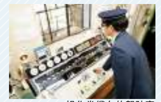
操作卷缆车的驾驶室