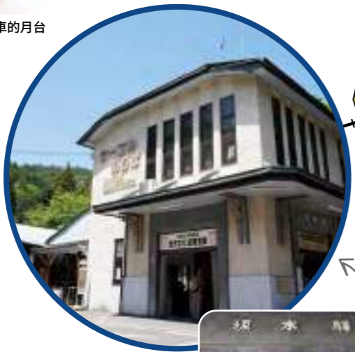
可從正面觀看纜車的月台

纜車在坂本的始發車站，曾作為延歷寺前小鎮繁榮一時。車站建於大正14年，是歐式木質兩層建築。建設之初以現代化的歐式建築風格廣受歡迎。1997年被日本國家註冊有形文化遺產收錄。