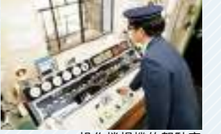
操作捲揚機的駕駛室