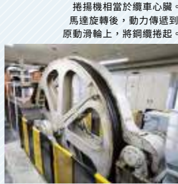
捲揚機相當於纜車心臟。馬達旋轉後，動力傳遞到原動滑輪上，將鋼纜捲起。