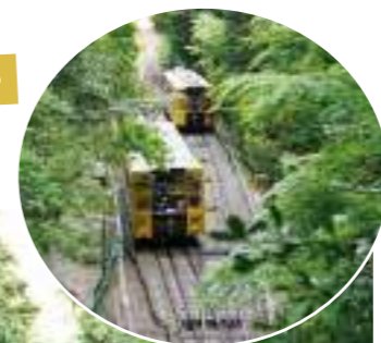
纜車路線為單行，上下行共用同一條線，中間有錯車地點，稱作「岔線」。綠號和福號兩列纜車錯身而過的瞬間不容錯過！