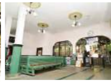
車站內部裝修配色復古，充滿大正風情，建築風格令人懷念