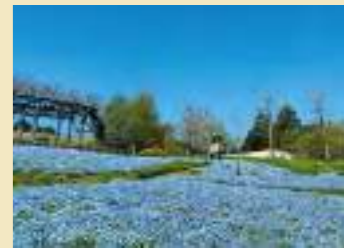
가든 뮤지엄 히에이