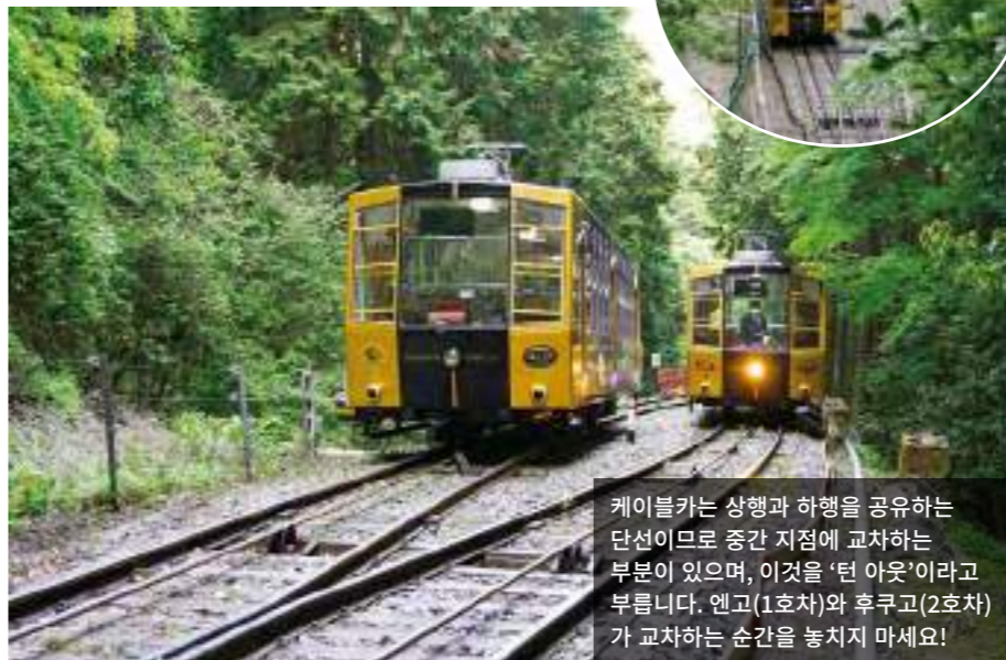
케이블카는 상행과 하행을 공유하는 단선이므로 중간 지점에서 교차하는 부분이 있으며, 이것을 '턴 아웃'이라고 부릅니다. 엔고(1호차)와 후쿠고(2호차) 가 교차하는 순간을 놓치지 마세요!