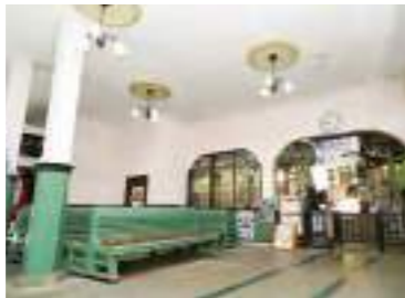
레트로한 배색이나 타이쇼 시절의 낭만이 감도는 건축 양식이 옛 정취를 불러 일으키는 역의 인테리어