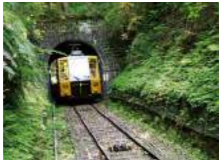
호라이오카역 근처의 나무숲에 둘러싸인 터널을 지나 히에이잔 산을 뚫고 올라 간다