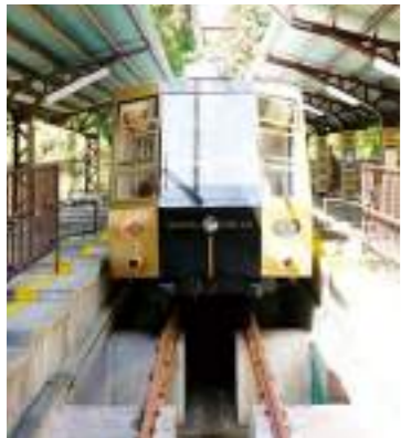
정면에서 케이블이 보이는 플랫폼