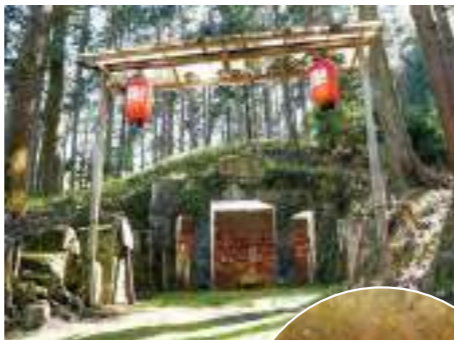
영굴의 석물 (호라이오카 지장)

사카모토 측의 중간역. 역 옆에는 건설 시에 발굴된 많은 석물을 안치하고 있는 영굴이 있습니다. 노부나가의 히에이잔 산 화공으로 희생된 사람들의 영혼을 위로하기 위해 지역 사람들이 모신 것으로 전해지고 있습니다.