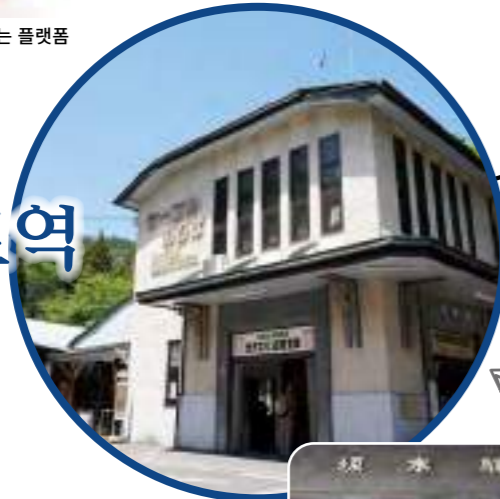
옛 역명이 기재된 역사 입구

엔라쿠지 절의 근처 마을로 변창한 사카모토에서 출발하는 케이블카 승강장. 1925년에 건설된 서양식 목조 2층 건물 역사는 건설 당시 모던한 서양식 건축으로 인기를 끌었습니다. 1997년에 국가 등록 유형 문화재로 등록되었습니다.