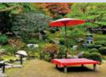
구 치쿠린인 정원