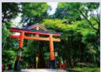
히요시 타이샤 신사