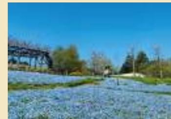
ガーデンミュージアム比叡