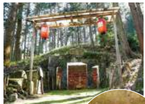
霊窟の石仏 (蓬萊丘地藏)

坂本側の中間駅。駅の隣には、建設時に発掘された多数の石仏を安置している霊窟が。信長の比叡山焼き討ちで犠牲になった人々の霊を慰めるため、土地の人々が祀ったものと伝えられています。