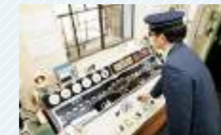
巻上機を操作する運転室