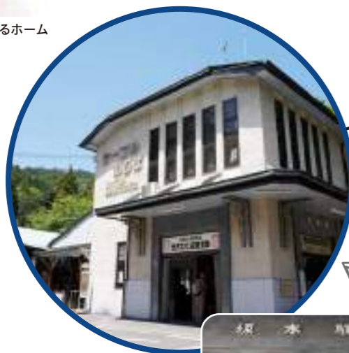
旧駅名が記された 駅舎入口

延暦寺の門前町として栄えた坂本からのケーブルのりば。大正14年に建設された洋風木造二階建の駅舎は、建設当時モダンな洋風建築として人気を博しました。1997年に国の登録有形文化財に登録されています。