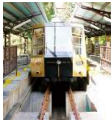
真正面からケーブルが見られるホーム