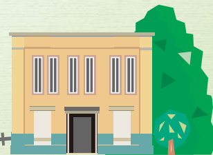
ケーブル延暦寺駅 Cable Enryakuji Sta. Station Cable Enryaku-ji