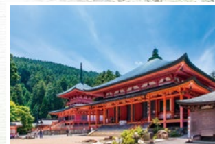
比叡山延暦寺(東塔) Hieizan Enryakuji Temple (To-do) Temple Hieizan Enryaku-ji (Tour Est)