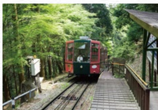
もたて山駅 Motateyama Sta. Station Motate-yama

Les croisières sont au départ de l'embarcadere situé devant la gare de « Biwako-Hamaôtsu », à environ 16 minutes de train, en prenant le train Keihan Railway à partir de la gare de « Sakamoto-Hieizanguchi » au pied de la montagne.