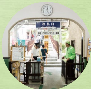
ほうらい丘駅 Horaioka Sta. Station Hōrai-oka